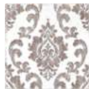
E234166 Miranda Greige