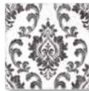
E234122 Miranda Charcoal