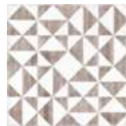
E234116 Mallorca Greige