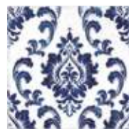
E234164 Miranda Navy